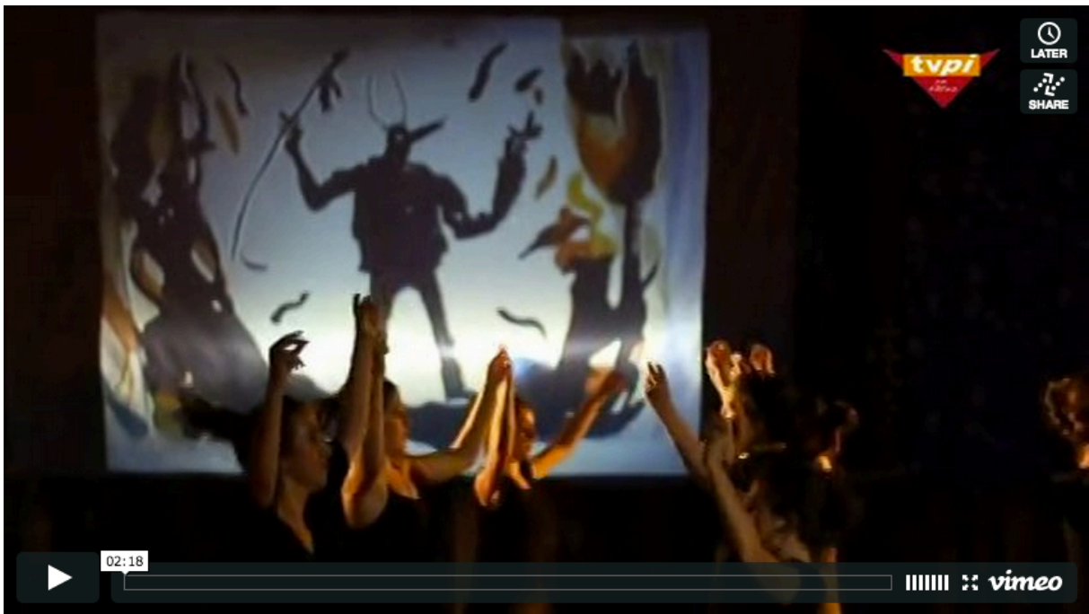
Reportage TVPI à Baleapop 2013 : https://vimeo.com/72820936