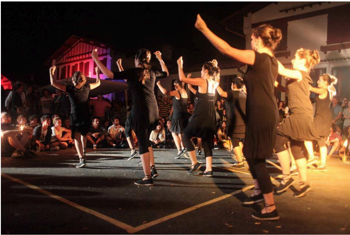
Work in progress à Baleapop