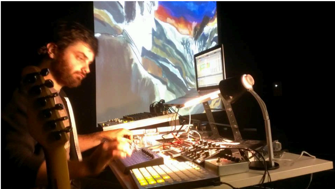
Résidence au Centre Culturel d'Intxaurondo