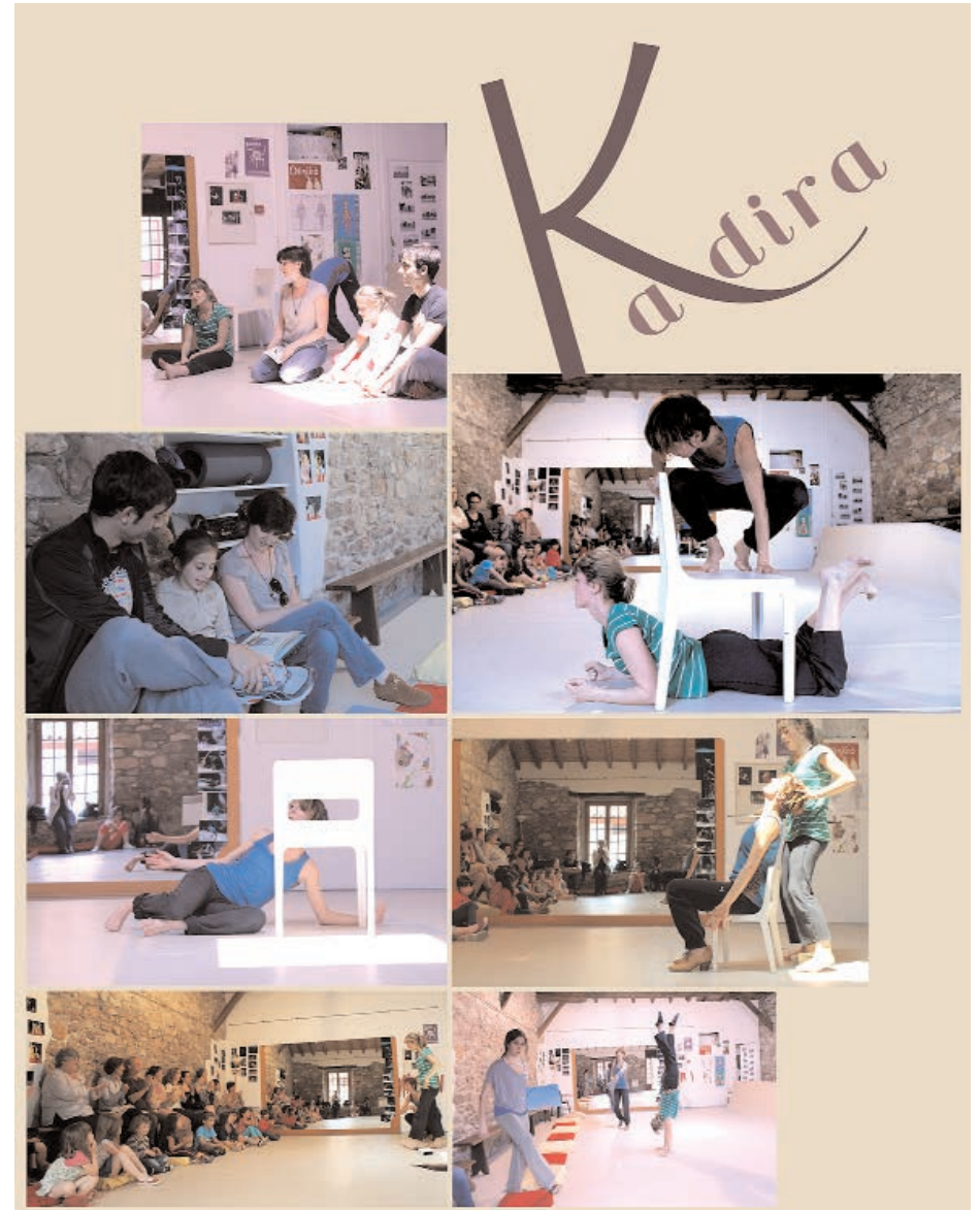
Photos de la répétition publique du 27 juin à Ascain