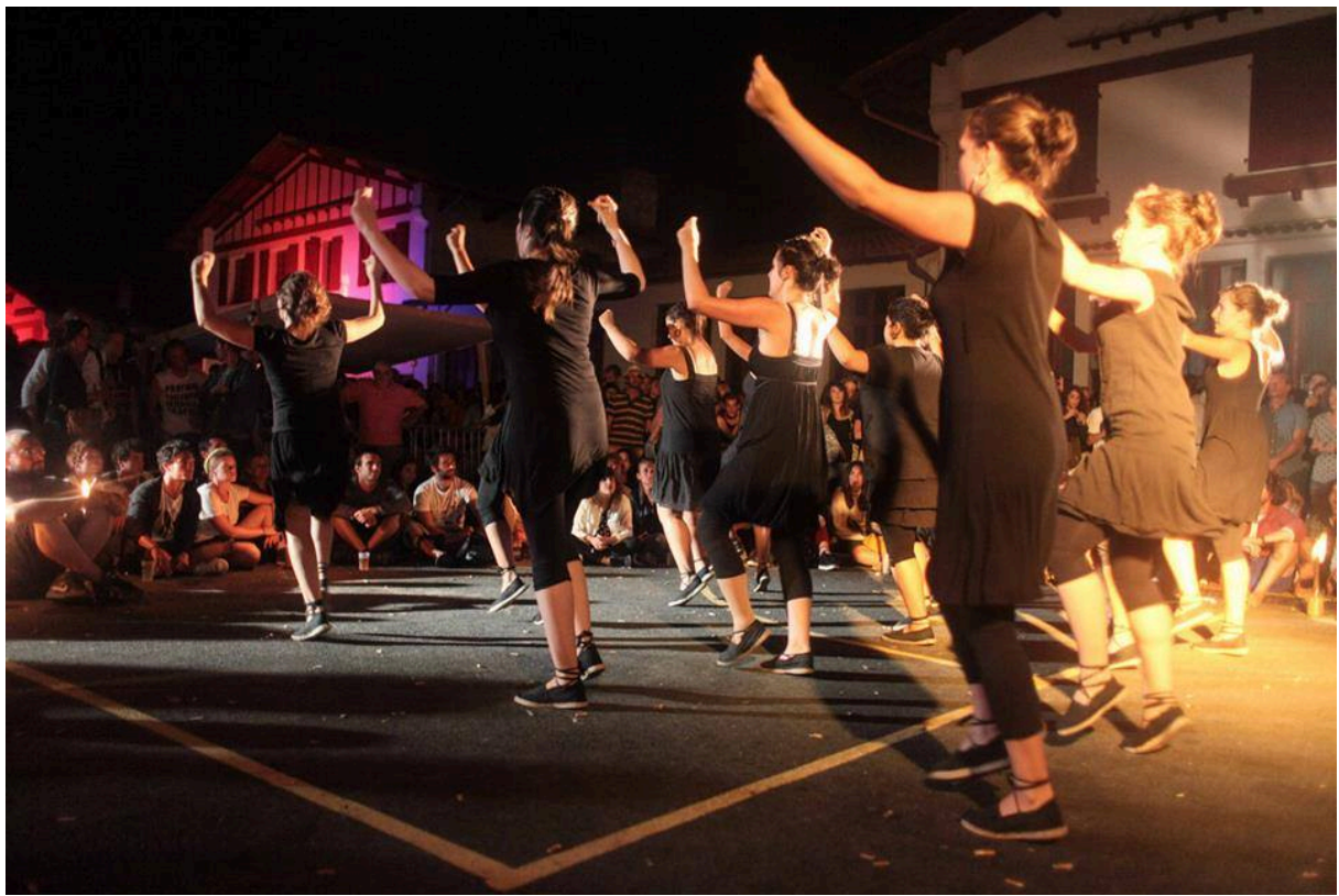
Work in progress – Baleapop Festibala