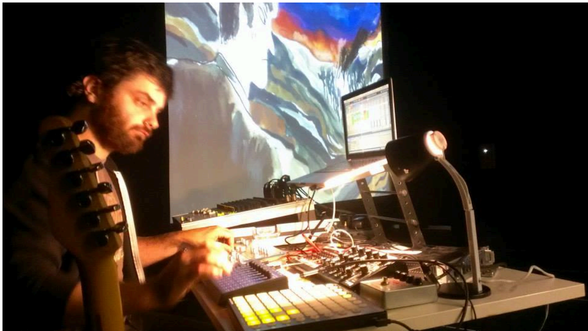
egonaldia intxaurrondo k.e – an