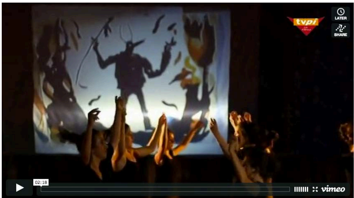
« Work in Progress » - Baleapop Festibala : https://vimeo.com/72820936