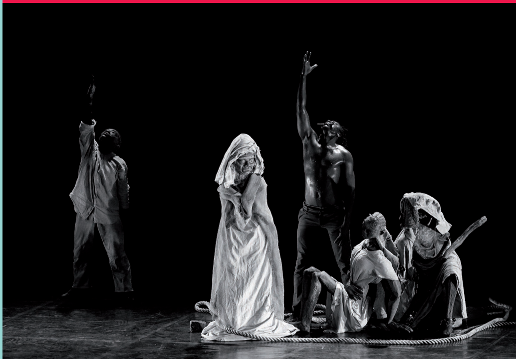
BELLA VITA PHOTOGRAPHY

MARTXOAREN 20 a , IGANDEA | 18:00 | COLISÉE |